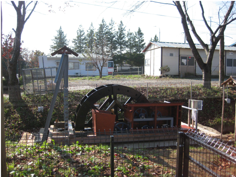
上: 日中に水車が動いている様子です 右: 夜間照明が点灯している所です