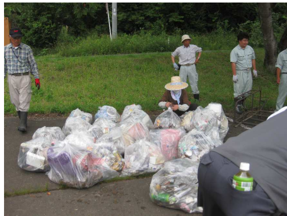
分別後役場のトラックに積み込み

毎年参加している方々からは「今年は例年よりポイ捨てゴミが少なかった」との感想も聞かれました。午後からは当会メンバーにより、釜房大橋から大針方面に向かう町道沿いに植えられている桜並木の下の草刈りと、絡みついた藤などの蔓切りを行いました。