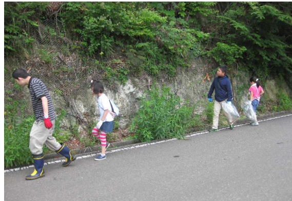
交通安全のため少人数で行動